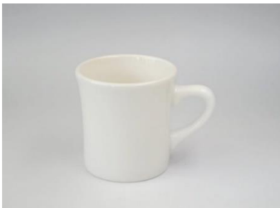
YA-007 φ 7.8 × 6.7 × H 8.1 210cc