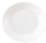
YOD-030 φ 13.5 × H 2.0