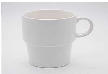
YA-019 φ 8.6 × 6.8 × H 8.7 330cc