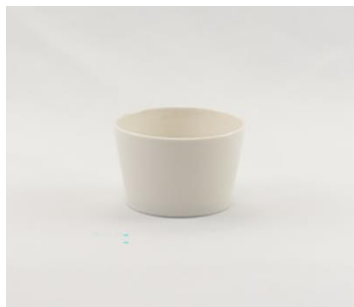
YOD-039 φ 8.5 × H 5.5 200cc