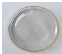
オリジナル釉薬例