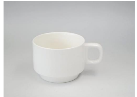
YA-006 φ 8.6 × 6.5 × H 6.4 250cc