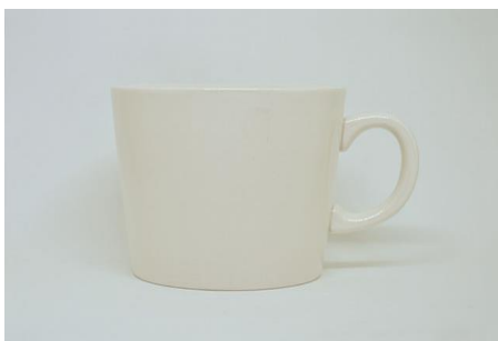
Y-002 \phi 8.9 \times 7.3 \times H 7.9 310cc