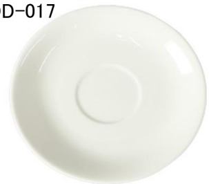
YOD-018 φ 15.1 × H 2.3