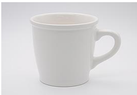
YA-017 φ 8.8 × 6.6 × H 9.0 310cc