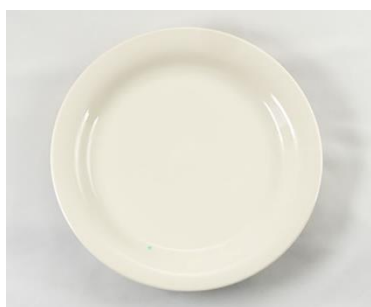
YOD-043 φ 24.5 × H 2.5