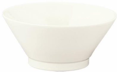
YOD-025 φ 18.0 × H 9.0 1000cc