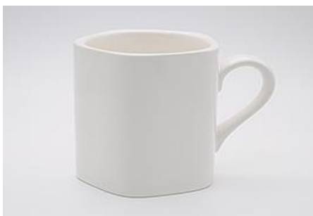
YA-020 φ 8.4 × H 9.0 330cc