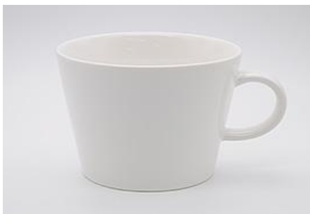
YA-014 φ 10.4 × 7.8 × H 8.2 400cc