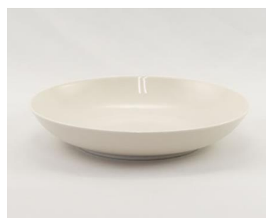
YOD-045 φ 21.5 × H 4.0

※ハンドルのサイズは含みません。 ※サイズは多少誤差が御座います。 ※容量は満水時です。※サイズはcmです。