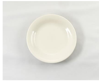
YOD-042 φ 16.0 × H 2.0