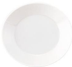
YOD-032 φ 19.5 × H 2.5