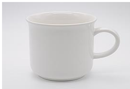
YA-015 φ 9.0 × 8.4 × H 8.4 350cc