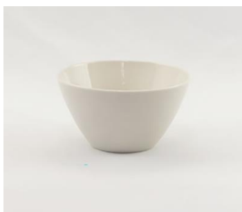
YOD-038 φ 13.0 × H 7.5 450cc