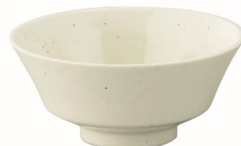
反型 茶碗、どんぶり