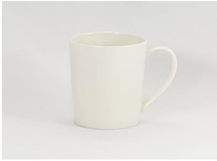
YOD-001 φ 8.0 × H 10.0 350cc