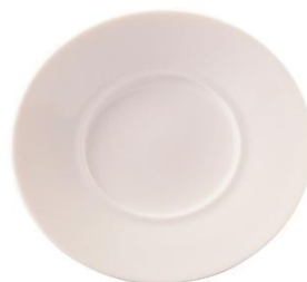
YOD-020 φ 15.5 × H 1.5

※ハンドルのサイズは含みません。 ※サイズは多少誤差が御座います。 ※容量は満水時です。※サイズはcmです。