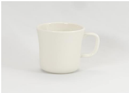
YOD-007 φ 8.5 × H 9.0 300cc