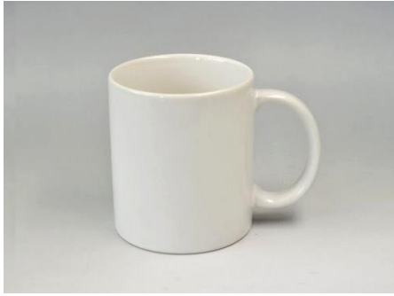
YA-001 φ 8.0 × H 9.1 300cc