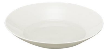
YOD-034 φ 21.5 × H 4.0