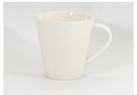
YOD-012 φ 10.0 × H 11.5 500cc

※ハンドルサイズは含みません。 ※サイズは多少誤差が御座います。 ※容量は満水時です。※サイズはcmです。