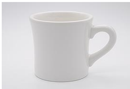
YA-013 φ 8.6 × 7.6 × H 8.0 280cc