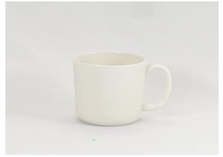
YOD-015 φ 8.0 × H 7.5 250cc