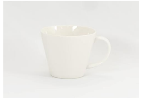
YOD-009 φ 9.5 × H 8.5 340cc