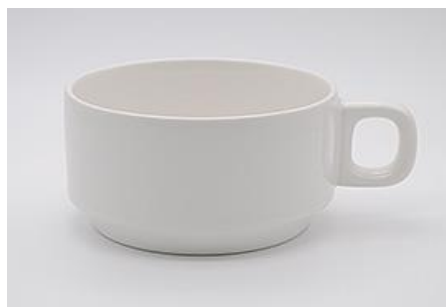
YA-021 φ 10.4 × H 6.0 350cc

※ハンドルのサイズは含みません。 ※サイズは多少誤差が御座います。 ※容量は満水時です。※サイズはcmです。