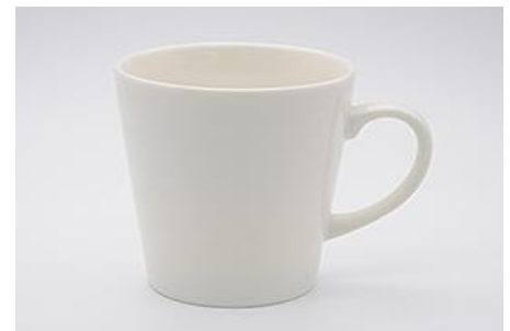
YA-009 8.0 × 6.0 × H 8.4 250cc