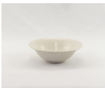
YOD-044 φ 16.0 × H 5.0