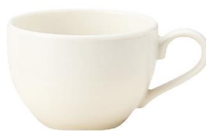
YOD-017 φ 8.5 × H 6.5 230cc