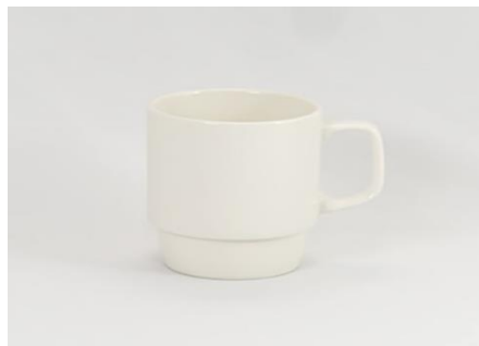
YOD-010 φ 8.5 × H 8.5 340cc