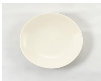
YOD-036 φ 19.5 × H 2.5