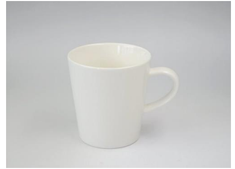
YA-003 φ 7.7 × 5.8 × H 9.1 280cc