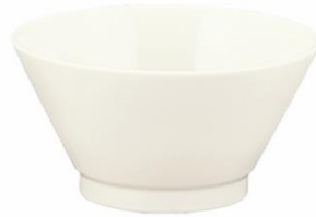
YOD-023 φ 12.0 × H 7.0 360cc