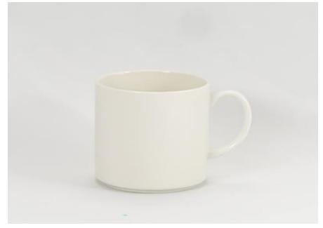
YOD-003 φ 8.5 × H 8.5 350cc