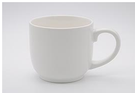
YA-018 φ 8.2 × H 8.0 300cc