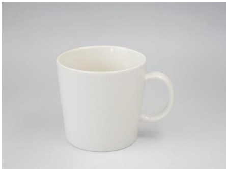
YA-004 φ 8.3 × 7.1 × H 8.2 280cc