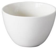
YOD-021 φ 8.2 × H 6.0 170cc