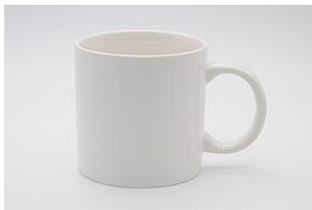
Y-004 \phi 7.1 \times H 8.0 230cc

※ハンドルのサイズは含みません。 ※サイズは多少誤差が御座います。 ※容量は満水時です。※サイズはcmです。