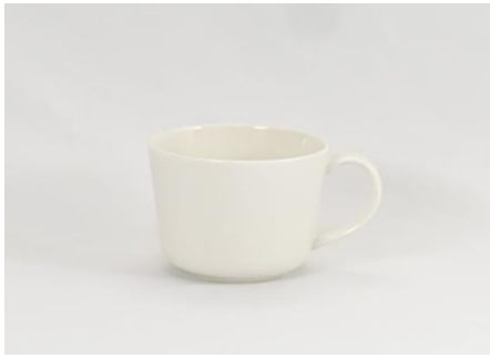
YOD-013 φ 8.5 × H 7.0 250cc