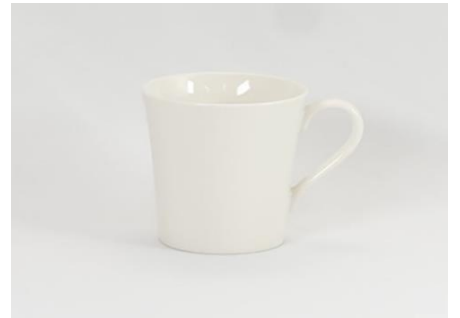
YOD-006 φ 8.5 × H 9.0 300cc