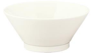
YOD-024 φ 15.0 × H 8.0 650cc