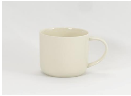
YOD-014 φ 8.5 × H 8.0 350cc