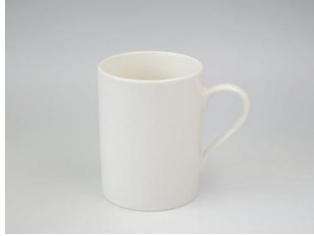
YA-002 φ 7.1 × H 9.4 280cc