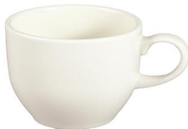
YOD-016 φ 7.7 × H 6.4 180cc