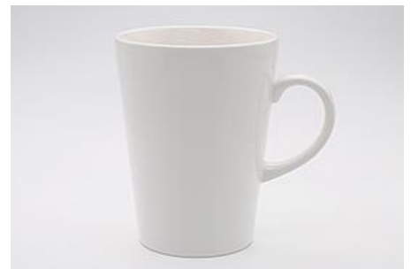
YA-012 8.9 × 6.5 × H 12.7 450cc

※ハンドルのサイズは含みません。 ※サイズは多少誤差が御座います。 ※容量は満水時です。※サイズはcmです。