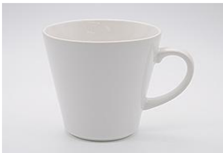
YA-010 φ 8.9 × 6.0 × H 8.8 280cc