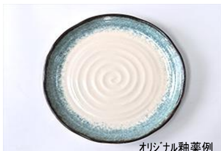
オリジナル釉薬例