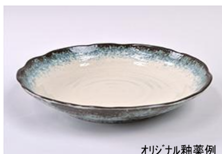
オリジナル釉薬例