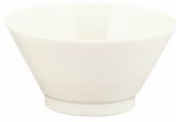
YOD-022 φ 10.0 × H 6.0 200cc