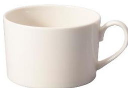
YOD-019 φ 8.5 × H 6.0 280cc