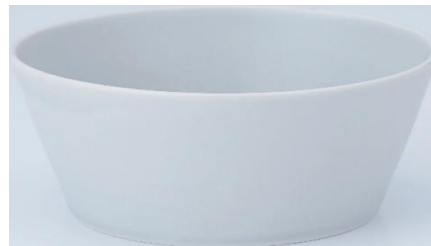
軽量 シリアルボール