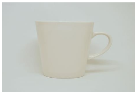
Y-003 \phi 8.2 \times 5.8 \times H 8.4 240cc